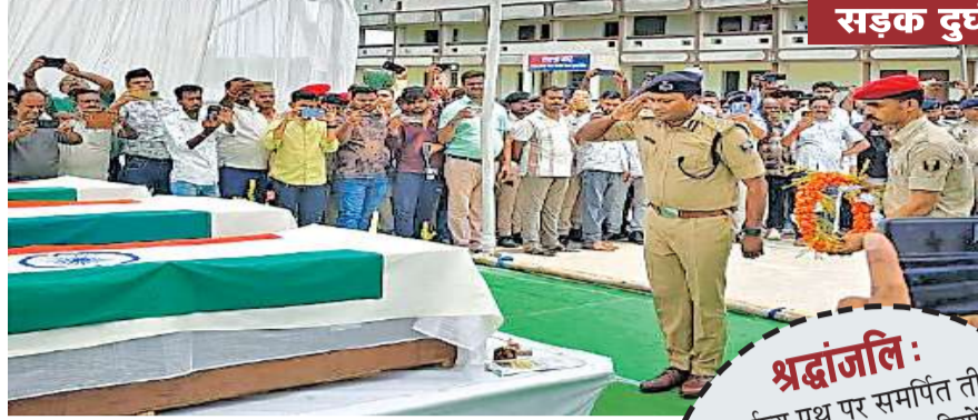
सड़क दुर्घटना में तीन थानाध्यक्षों के निधन से शोक की लहर : स्तब्ध है मधेपुरा