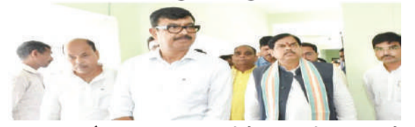
न्यूज स्केल पटना