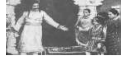
03 मई : भारतीय सिनेमा के इतिहास में मील का पत्थर 'राजा हरिश्चंद्र'