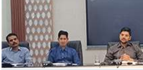
हर माह के प्रथम और तृतीय मंगलवार को लगेगा "सहयोग शिविर"

शिविर में ही मिलेगी लंबित और निष्पादित मामलों की जानकारी सहयोग शिविर में अपर समाहर्ता, राजस्व, भूमि सुधार उप-समाहर्ता एवं अंचल अधिकारी स्तर के पदाधिकारी अपने-अपने न्यायालयों में लंबित एवं निष्पादित वादों तथा मामलों की सूची का प्रदर्शन करेंगे। इससे संबंधित व्यक्तियों को उनके मामलों की स्थिति