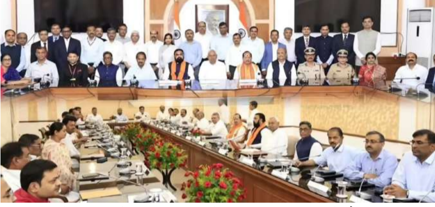
कई मंत्रियों ने इस क्षण को "एक युग के अंत" के रूप में बताया। बैठक के बाद मुख्यमंत्री ने राज्यपाल को अपना इस्तीफा सौंप दिया, जिसके साथ ही राज्य में मौजूदा सरकार का औपचारिक अंत हो गया।

सूत्रों के अनुसार, मुख्यमंत्री नीतीश कुमार की अध्यक्षता में हुई अंतिम कैबिनेट बैठक लगभग 20 मिनट चली, जिसमें मौजूदा सरकार को भंग करने की अनुशंसा को सर्वसम्मति से मंजूरी दी गई। बैठक के दौरान माहौल काफी भावुक रहा। नीतीश कुमार ने मंत्रियों को संबोधित करते हुए कहा कि यह एक नया राजनीतिक चरण है और उन्होंने सभी सहयोगियों के प्रति आभार व्यक्त किया।