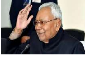
सिर्फ नेतृत्व परिवर्तन नहीं, बल्कि बिहार की राजनीति के नए समीकरणों की शुरुआत भी हो सकता है।