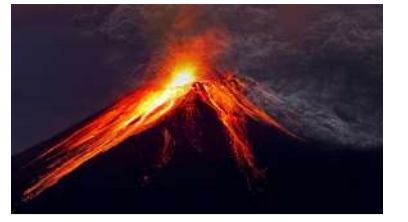
17 अप्रैल : तमबोरा ज्वालामुखी विस्फोट ने मचाई थी वैश्विक तबाही