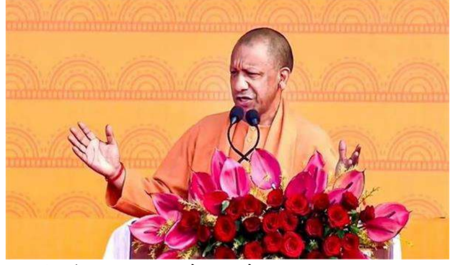
मजबूत होगी और विकास को नई दिशा मिलेगी। उन्होंने