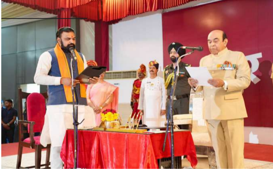
न्यूज स्केल पटना,

« राज्यपाल ने दिलाई शपथ, मुख्यमंत्री-उपमुख्यमंत्री सहित तमाम दिग्गज नेता रहे मौजूद; समर्थकों में उमड़ा उत्साह, सुरक्षा के कड़े इंतजाम »