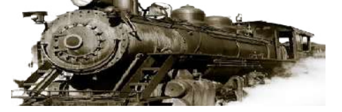
16 अप्रैल 1853 : ब्रिटिश शासन के दौरान भारत में मुंबई के बोरीबंदर से ठाणे तक पहली यात्री ट्रेन चलाई गई।