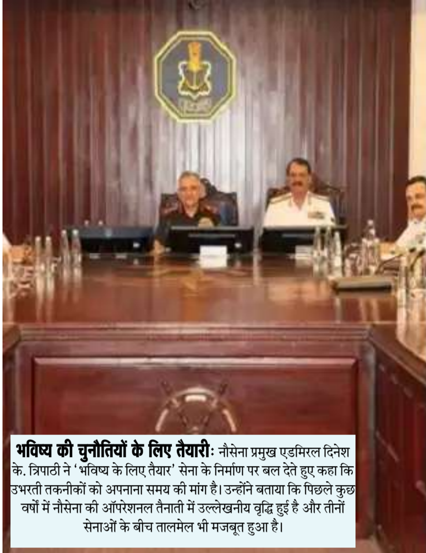
भविष्य की चुनौतियों के लिए तैयारी: नौसेना प्रमुख एडमिरल दिनेश के. त्रिपाठी ने 'भविष्य के लिए तैयार' सेना के निर्माण पर बल देते हुए कहा कि उभरती तकनीकों को अपनाया समय की मांग है। उन्होंने बताया कि पिछले कुछ वर्षों में नौसेना की ऑपरेशनल तैनाती में उल्लेखनीय वृद्धि हुई है और तीनों सेनाओं के बीच तालमेल भी मजबूत हुआ है।

'नैरेटिव वॉरफेयर' का बढ़ता प्रभाव: नौसेना प्रमुख ने कहा कि आज के दौर में युद्ध केवल जमीन या समुद्र तक सीमित नहीं है, बल्कि 'नैरेटिव वॉरफेयर' के जरिए जनमत को भी प्रभावित किया जा रहा है। उन्होंने कहा कि वैश्विक शक्ति संतुलन तेजी से बदल रहा है और प्रतिस्पर्धा का दौर अब संघर्ष में बदलता जा रहा है। सम्मेलन में संयुक्तता, क्षमता विकास, प्रशिक्षण, विदेशी सहयोग और स्वदेशीकरण जैसे मुद्दों पर विस्तृत चर्चा की गई। भारतीय नौसेना ने 'लड़ाई के लिए तैयार, भरोसेमंद, एकजुट और भविष्य के लिए तैयार' बनने की दिशा में अपनी प्रतिबद्धता दोहराई।