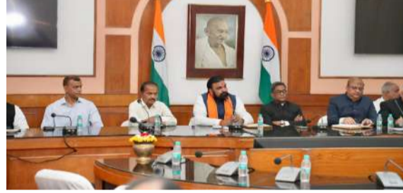
प्राथमिकताओं, विकास योजनाओं और प्रशासनिक कार्यप्रणाली को लेकर

शपथ ग्रहण समारोह में राज्य के मुख्यमंत्री, उपमुख्यमंत्री, मंत्रिमंडल के वरिष्ठ मंत्री, विधानसभा एवं विधान परिषद के कई सदस्य, वरिष्ठ प्रशासनिक अधिकारी, पुलिस विभाग के उच्च पदाधिकारी तथा विभिन्न राजनीतिक दलों के प्रमुख नेता उपस्थित रहे। इसके अलावा बड़ी संख्या में आमंत्रित अतिथि और पार्टी कार्यकर्ता भी मौजूद थे।