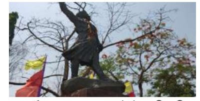
18 अप्रैल : तात्या टोपे की वीरता और आइंस्टीन के निधन से जुड़ी अहम तिथि