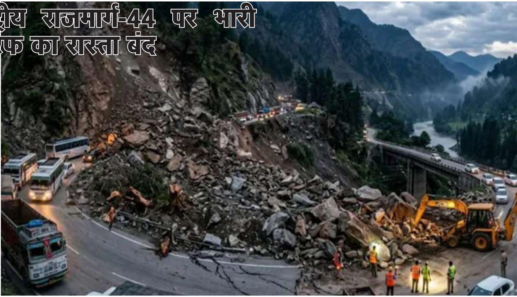
और बनिहाल होते हुए श्रीनगर तक जाता है। फिलहाल यात्रियों को वैकल्पिक मार्गों और प्रशासनिक निर्देशों का पालन करने की सलाह दी गई है।

नई दिल्ली, (हि.स.) जम्मू को श्रीनगर से जोड़ने वाला प्रमुख जम्मू-श्रीनगर राष्ट्रीय राजमार्ग-44 रविवार तड़के भारी भूस्खलन के कारण पूरी तरह बंद हो गया। करोल ब्रिज और चंदरकोट के बीच अचानक पहाड़ी से बड़े-बड़े पत्थर गिरने और मिट्टी खिसकने से दोनों ओर का मार्ग अवरुद्ध हो गया, जिससे यातायात पूरी तरह ठप पड़ गया है। जानकारी के अनुसार, यह घटना सुबह करीब तीन बजे हुई, जब अचानक पहाड़ का एक हिस्सा टूटकर राजमार्ग पर आ गया। इस वजह से सड़क के दोनों ओर वाहनों की लंबी कतारें लग गईं और कई वाहन बीच रास्ते में ही फंस गए। यात्रियों को घंटों तक इंतजार करना पड़ा और उन्हें काफी कठिनाइयों का सामना करना पड़ रहा है। प्रशासन और संबंधित एजेंसियों की ओर से मलबा हटाने और सड़क को फिर से चालू करने के प्रयास जारी हैं, लेकिन लगातार हो रहे भूस्खलन और बड़े पत्थरों के गिरने से राहत कार्यों में बाधा आ रही है। मौके पर मशीनरी और कर्मचारी तैनात किए गए हैं, जो मार्ग को साफ करने में जुटे हुए हैं। गौरतलब है कि यह राष्ट्रीय राजमार्ग लगभग 247 किलोमीटर लंबा है और कश्मीर घाटी को देश के बाकी हिस्सों से जोड़ने वाला सबसे महत्वपूर्ण मार्ग माना जाता है। यह मार्ग जम्मू से शुरू होकर उधमपुर, रामबन (रामसू)