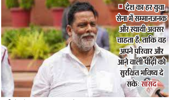
देश का हर युवा सेना में सम्मानजनक और स्थायी अवसर चाहता है, ताकि वह अपने परिवार और आने वाली पीढ़ी को सुरक्षित भविष्य दे सके: सांसद

पूर्णिमा के सांसद राजेश रंजन उर्फ पप्पू यादव ने अग्निवीर योजना को लेकर गंभीर चिंता जताई है। उन्होंने कहा कि देश की सुरक्षा से जुड़े मामलों में व्यापक चर्चा और सहमति बेहद जरूरी है। उनका मानना है कि यदि सैनिकों के भविष्य को लेकर असुरक्षा की भावना पैदा होती है, तो इसका सीधा असर सेना के मनोबल पर पड़ सकता है। उन्होंने सरकार से आग्रह किया कि इस योजना पर स्पष्ट नीति सामने लाई जाए और जरूरत पड़ने पर इसे उच्च स्तरीय समिति के पास भेजकर विस्तृत समीक्षा कराई जाए।