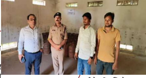
शिकायत के लिए हेल्पलाइन नंबर जारी: यदि किसी उपभोक्ता को गैस से संबंधित कोई समस्या होती है, तो वे जिला आपदा प्रबंधन कार्यालय के नियंत्रण कक्ष के दूरभाष नंबर—06454-242319, 242317 एवं 242320—पर संपर्क कर सकते हैं। प्रशासन द्वारा प्राप्त शिकायतों पर त्वरित कार्रवाई की जा रही है।

जिला प्रशासन की सतत निगरानी के बीच पूर्णिमा में एलपीजी गैस की आपूर्ति पूरी तरह सामान्य बनी हुई है। रविवार को जिले भर में कुल 7803 गैस सिलेंडरों का सफलतापूर्वक वितरण उपभोक्ताओं के बीच किया गया, जबकि विभिन्न एजेंसियों के पास अभी भी 19689 सिलेंडर पर्याप्त स्टॉक के रूप में सुरक्षित हैं।