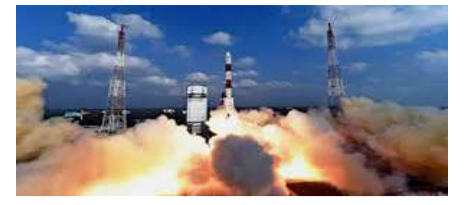
1992 - भारत ने अंतरिक्ष क्षेत्र में प्रगति करते हुए इसरो के नए उपग्रह कार्यक्रमों को आगे बढ़ाया।