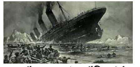
10 अप्रैल : जब 'टाइटैनिक' ने भरी थी पहली और आखिरी उड़ान, इतिहास बना त्रासदी की पहचान