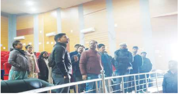
कार्यक्रम की तैयारियों को लेकर प्रेक्षा गृह सह आर्ट गैलरी का जायज लेते, अधिकारियों के साथ जिला पदाधिकारी

बिहार सरकार के उपमुख्यमंत्री सह मंत्री राजस्व एवं भूमि सुधार विभाग विजय कुमार सिन्हा आज पूर्णिया के प्रेक्षागृह सह आर्ट गैलरी, मे जनता से सीधा सीधा संवाद करेंगे। इस जन कल्याण संवाद कार्यक्रम में भूमि एवं राजस्व से संबंधित समस्याओं को लेकर आने वाले नागरिकों को सीधे उपमुख्यमंत्री के समक्ष अपनी बात रखने का अवसर मिलेगा। संवाद के दौरान मंत्री स्वयं शिकायतें सुनेंगे तथा नियमसंगत समाधान के लिए संबंधित अधिकारियों को निर्देशित करेंगे।