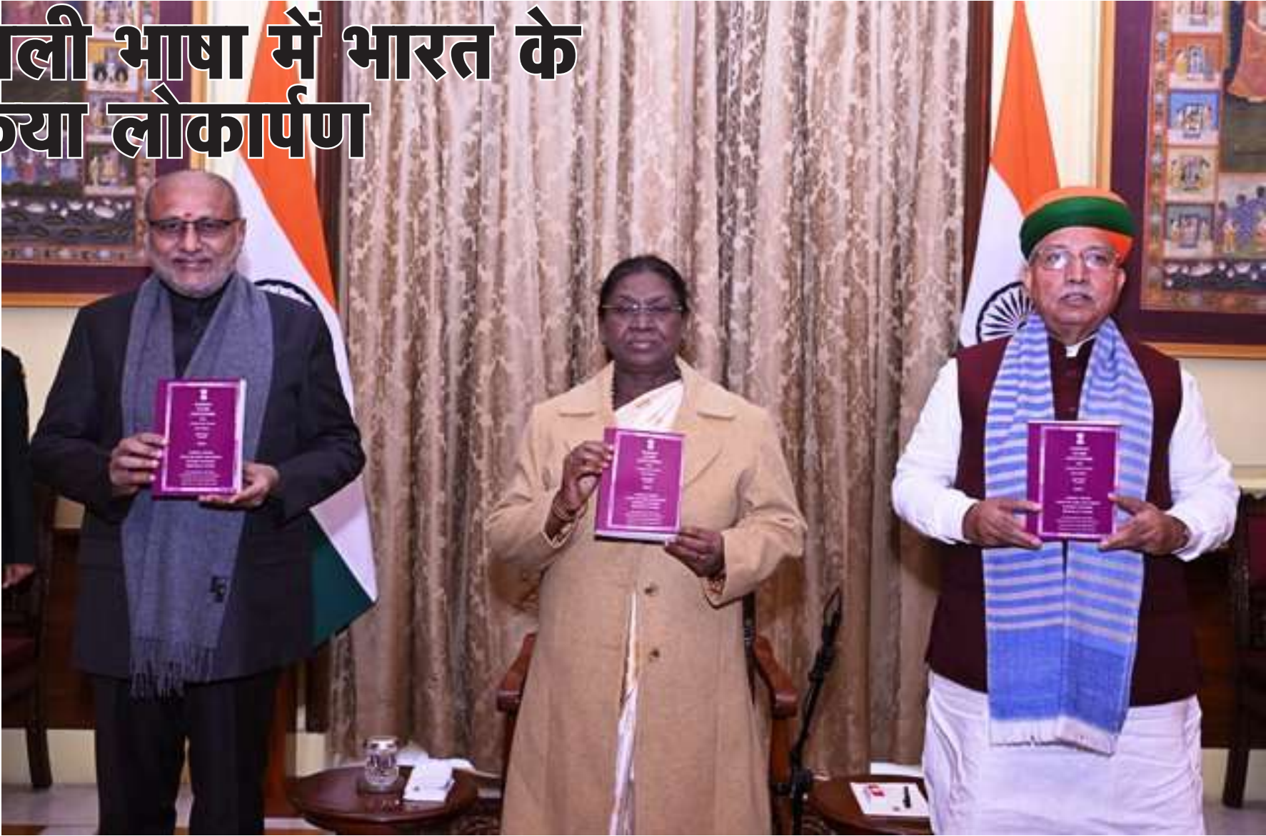
उल्लेखनीय है कि संताली भाषा भारत की प्राचीन

नई दिल्ली, (हि.स.) राष्ट्रपति द्रौपदी मुर्मू ने गुरुवार को संताली भाषा में भारत के संविधान का औपचारिक लोकार्पण किया। यह संविधान संताली भाषा की अलचिकी लिपि में प्रकाशित किया गया है। राष्ट्रपति मुर्मू ने इस अवसर पर राष्ट्रपति भवन में आयोजित समारोह को संबोधित करते हुए कहा कि संताली समुदाय के लिए यह गर्व और हर्ष का विषय है कि अब भारत का संविधान उनकी अपनी भाषा और लिपि में उपलब्ध है। इससे संताली भाषी लोग संविधान को सीधे पढ़ और समझ सकेंगे। उन्होंने कहा कि संविधान की मूल भावना और उसके अनुच्छेदों को मातृभाषा में समझने का अवसर मिलना लोकतंत्र को और सशक्त बनाता है। राष्ट्रपति ने कहा कि वर्ष 2025 अलचिकी लिपि के शताब्दी वर्ष के रूप में मनाया जा रहा है और ऐसे महत्वपूर्ण वर्ष में संविधान का अलचिकी लिपि में प्रकाशन अत्यंत सराहनीय है। उन्होंने इसके लिए केंद्रीय कानून एवं न्याय मंत्री और उनकी टीम की प्रशंसा की। अपने संबोधन में राष्ट्रपति ने कहा कि ओडिशा, झारखंड, पश्चिम बंगाल, असम और बिहार में रहने वाले संताली समाज के लोग अब अपनी मातृभाषा और लिपि में लिखे गए संविधान के माध्यम से अपने अधिकारों और कर्तव्यों को बेहतर ढंग से समझ सकेंगे। समारोह में उपराष्ट्रपति सी. पी. राधाकृष्णन और केंद्रीय कानून एवं न्याय राज्य मंत्री अर्जुन राम मेघवाल सहित कई गणमान्य व्यक्ति उपस्थित रहे।