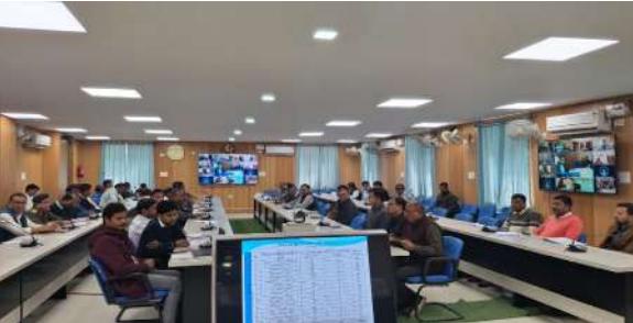
सीपीजीआरएम और अन्य विभागीय कार्यों की प्रगति का विस्तृत मूल्यांकन किया गया।