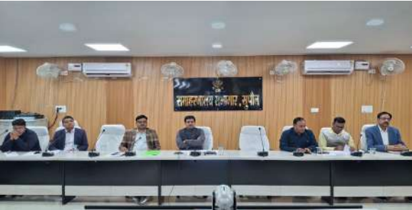
बैठक में दाखिल-खारिज मामलों और न्यायालय संबंधी लंबित वादों की समीक्षा की गई।