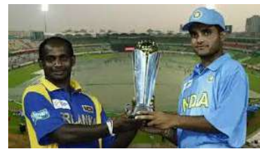
3 नवंबर 2002 को भारत ने ICC चैंपियंस ट्रॉफी में श्रीलंका से साझा खिताब जीता।