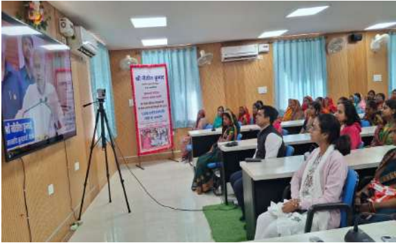
78 हजार से अधिक जीविका दीदियों ने प्रसारण को देखा और सुना

उपलब्ध कराकर रोजगार की तरफ उन्मुख करना है। राज्य सरकार की अभूतपूर्व पहल से हर समुदाय तथा हर वर्ग के परिवारों की महिलायें इस योजना का लाभ ले सकती हैं। अपनी पसंद का रोजगार शुरु करने के लिये प्रारंभिक राशि 10 हजार दी जा रही है। बाद में आकलन कर दो लाख तक की राशि अतिरिक्त वित्तीय सहायता का प्रावधान है। लाभुकों को राज्य में सफलता पूर्वक कार्यरत 11 लाख से अधिक स्वयं सहायता समूहों से जुड़ी 1 करोड़ 40 लाख से अधिक जीविका दीदियों की