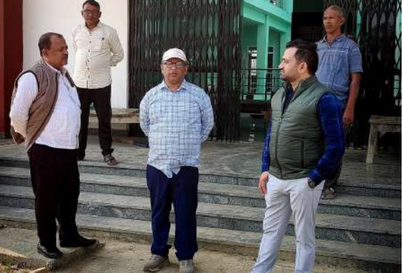
न्यूज स्केल नवादा

जिला पंचायत राज पदाधिकारी, नवादा ने जिला अभियंता व स्थानीय क्षेत्र अभियंत्रण संगठन के साथ निर्माणाधीन जिला पंचायत संसाधन केंद्र का स्थलीय निरीक्षण किया। निरीक्षण के दौरान भवन निर्माण में पाई गई कुछ त्रुटियों को एक सप्ताह के भीतर सुधारने का निर्देश संबंधित एजेंसी को दिया गया, ताकि भवन हस्तांतरण प्रक्रिया समय पर पूरी हो सके। साथ ही, केंद्र तक सुगम आवागमन सुनिश्चित करने