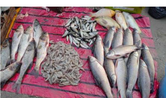
के अनुसार जलस्तर में कमी, प्रदूषण, अत्यधिक शिकार और प्राकृतिक आवास में तेज बदलाव इन मछलियों की संख्या घटने का मुख्य कारण बने हुए हैं। स्थानीय मछुआरे सरकार और मत्स्य विभाग से इन प्रजातियों के संरक्षण को लेकर ठोस कदम उठाने की मांग कर रहे हैं। उनका कहना है कि यदि जल्द पहल नहीं की गई,