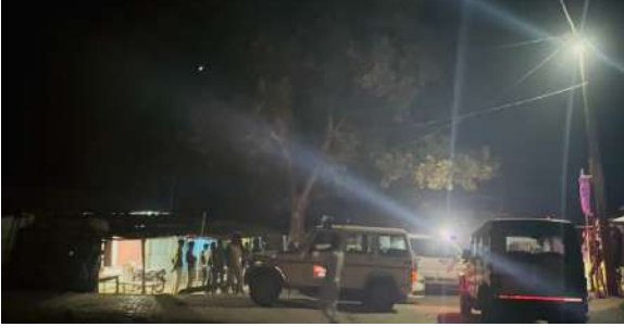
गया कि ऑपरेशन के दौरान कोई आवश्यक सुविधा मौजूद नहीं था एवं टूटे-फूटे अस्थाई घर में बेंच एवं टेबल पर हैलोजन लाइट में ऑपरेशन किया गया था। संबंधित मरीज को आगे की चिकित्सा हेतु राघोपुर अस्पताल भेज दिया गया तथा छापेमारी व अन्य अवैध सामानों को जप्त करने की कार्रवाई आधी रात तक जारी रही। इसी क्रम में वहीं पर

ड्रग इंस्पेक्टर को बुलाया गया तथा ड्रग इंस्पेक्टर की देखरेख में सारे सामानों को देर रात तक जप्त करने की प्रक्रिया की गई तथा अनुमंडल पदाधिकारी के द्वारा उन दोनों दुकानों पर भी आवश्यक कानूनी कार्रवाई करने का निर्देश दिया गया। इस क्रम में अनुमंडल पदाधिकारी के द्वारा बताया गया कि मरीज के जिंदगी से किया जा रहे खिलवाड़ को किसी भी परिस्थिति में बढ़ाश्त नहीं किया जाएगा तथा सुपौल में जो भी इस तरह के अवैध कार्यों में लगे हुए हैं वह सचेत हो जाएं अन्यथा छापेमारी की कार्रवाई लगातार जारी रखते हुए दोषियों के विरुद्ध आवश्यक कानूनी कार्रवाई की जाएगी।