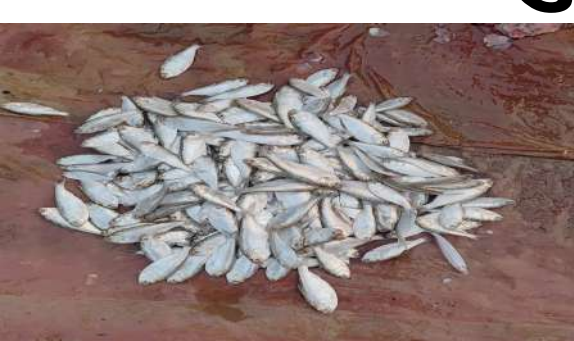
विक्रेताओं का कहना है कि यह मछली स्वाद में बेहतरीन, नरम और पौष्टिकता से भरपूर होती है। पहली बार आने के कारण ग्राहकों में इसे लेकर उत्सुकता भी देखी जा रही है। कई उपभोक्ताओं ने बताया कि सुई/सुहा मछली हल्की होने के साथ-साथ जल्दी पकने की वजह से भी पसंद की जा रही है। हालांकि, दूसरी ओर

न्यूज स्केल मरौना सुपौल सहित आसपास के स्थानीय मछली बाजारों में इस समय विभिन्न प्रजातियों की मांग और आपूर्ति को लेकर एक नया परिदृश्य सामने आने लगा है। आमतौर पर बाजारों में रोह, भाकुर, बीकेट, बिसकर और कोमल जैसी लोकप्रिय मछलियाँ आसानी से उपलब्ध हो जाती थीं, जिनकी स्थानीय उपभोक्ताओं में अच्छी खपत रहती है। इन मछलियों की कीमतें भी मौसम और मांग के अनुसार उतार-चढ़ाव दिखाती रहती हैं। इसी बीच बाजार में एक नई मछली की एंट्री हुई है— ‘सुई’, जिसे स्थानीय भाषा में ‘सुहा’ के नाम से भी जाना जाता है।