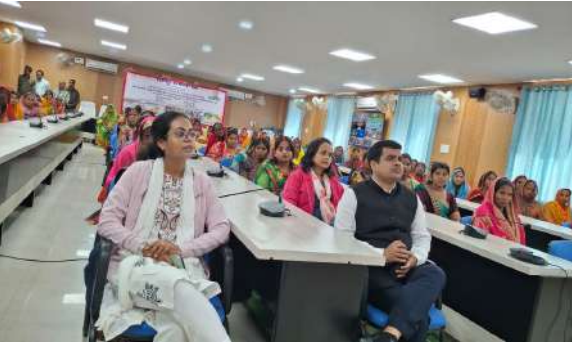
न्यूज स्केल सुपौल

शुक्रवार को मुख्यमंत्री नीतीश कुमार के द्वारा मुख्यमंत्री महिला रोजगार योजना अंतर्गत 1 लाख महिला लाभुकों को 10,000/- प्रति लाभुक की दर से 100 करोड़ की राशि का अन्तरण कार्यक्रम का सीधा प्रसारण पटना से आयोजित किया गया। समाहरणालय स्थित लहटन चौधरी सभागार में भी कार्यक्रम आयोजित किया गया। इस योजना के तहत राज्य के सभी परिवारों की एक महिला को रोजगार शुरु करने के लिये आर्थिक सहायता