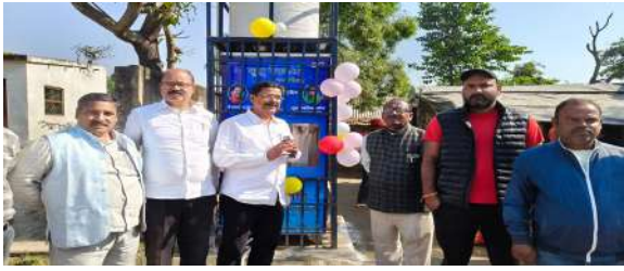
न्यूज स्केल सुपौल