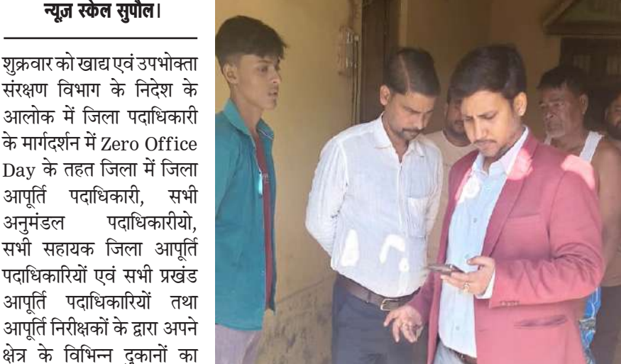
शुक्रवार को खाद्य एवं उपभोक्ता संरक्षण विभाग के निदेश के आलोक में जिला पदाधिकारी के मार्गदर्शन में Zero Office Day के तहत जिला में जिला आपूर्ति पदाधिकारी, सभी अनुमंडल पदाधिकारियों, सभी सहायक जिला आपूर्ति पदाधिकारियों एवं सभी प्रखंड आपूर्ति पदाधिकारियों तथा आपूर्ति निरीक्षकों के द्वारा अपने क्षेत्र के विभिन्न दुकानों का विशेष अभियान के तहत जन वितरण प्रणाली की दुकानों का निरीक्षण किया गया, जिसमें कुल 85 दुकानों का निरीक्षण किया गया। इसमें से 05 दुकानों में भंडार में अंतर, 01 दुकान में निर्धारित मात्रा से खाद्यान्न कम देने संबंधी अनियमितता

एक दुकान में निर्धारित से कम दी जा रही थी अनाज