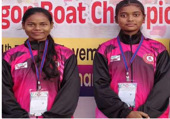
पूर्णिमा रग्बी फुटबॉल

महाराष्ट्र के नांदेड़ में आयोजित ड्रैगन बोट नेशनल चैंपियनशिप में बिहार की ड्रैगन बोट टीम ने बेहतरीन प्रदर्शन करते हुए 1000 मीटर और 500 मीटर दोनों श्रेणियों में स्वर्ण पदक अपने नाम किया। यह राज्य के खेल जगत के लिए गर्व का पल है।