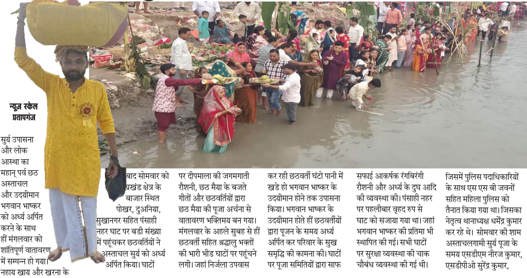
न्यूज स्केल प्रतापगंज

सूर्य उपासना और लोक आस्था का महान् पर्व छठ अस्ताचल और उदयीमान भगवान भाष्कर को अर्घ्य अर्पित करने के साथ ही मंगलवार को शांतिपूर्ण वातावरण में सम्पन्न हो गया। नहाय खाय और खरना के